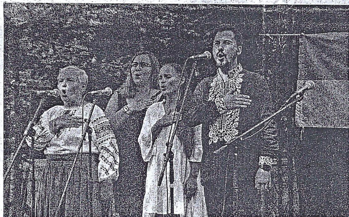
Gänsehautmoment: Die ukrainische Nationalhymne wird angestimmt.

„Wir sind den vielen Privatleuten dankbar, die sich hier engagieren und Geflüchtete bei sich aufnehmen. Doch es ist eine schwierige Situation für uns. Wir können nicht so schnell genügend Unterkünfte finden, wie Flüchtlinge kommen“, sagt Kretschmann. Schon jetzt seien deutlich mehr Flüchtlinge in Baden-Württemberg als 2015 während der damaligen „Flüchtlingskrise“. Kretschmann habe Verständnis dafür, dass die beengten Verhältnisse in den Gemeinschaftsunterkünften Probleme bereiten. „Aber im Vergleich zu dem, was die Ukrainer in ihrem eigenen Land erleben, ist es erträglich.“ Vor allem die Kommunen vor Ort seien hier gefragt.