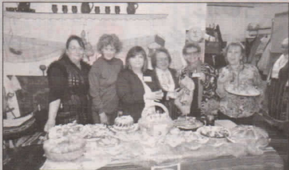
Клубовете към Съюза на пенсионерите в Русенска област се включиха в посрещането на гостите от Румъния и Германия

Международен семинар на тема "Обучение и доброволчество в третата възраст - нови перспективи за България, Румъния и Германия" събра над 50 делегати в Русенския университет. Той протече в дните от 9-и до 11-и май и на него бяха обсъдени обществените дейности за хората от третата възраст, "единна Европа", както и възможностите пред възрастните хора за обучение.